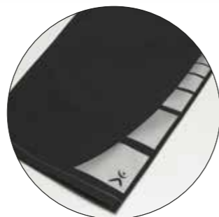
Motyw „Square” Nr art. 9901402 Wymiary: ok. 25 x 7,5 cm