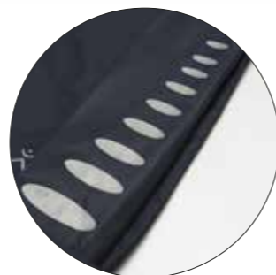
Motyw „Bubble” Nr art. 9901403 Wymiary: ok. 25 x 8,5 cm