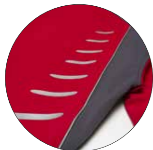
Motyw „Brush” Nr art. 9901401 Wymiary: ok. 25 x 9,5 cm