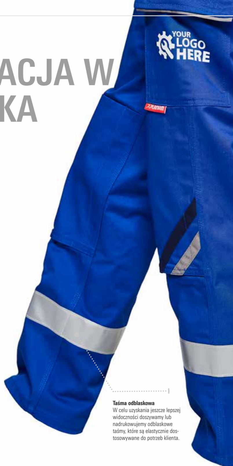
Taśma odbłaskowa W celu uzyskania jeszcze lepszej widoczności doszywamy lub nadrukujemy odbłaskowe taśmy, które są elastycznie dostosowywane do potrzeb klienta.

Ważna uwaga: Zastosowanie dodatkowych pasków odbłaskowych nie sprawia, że dana odzież jest uważana za odzież ostrzegawczą.